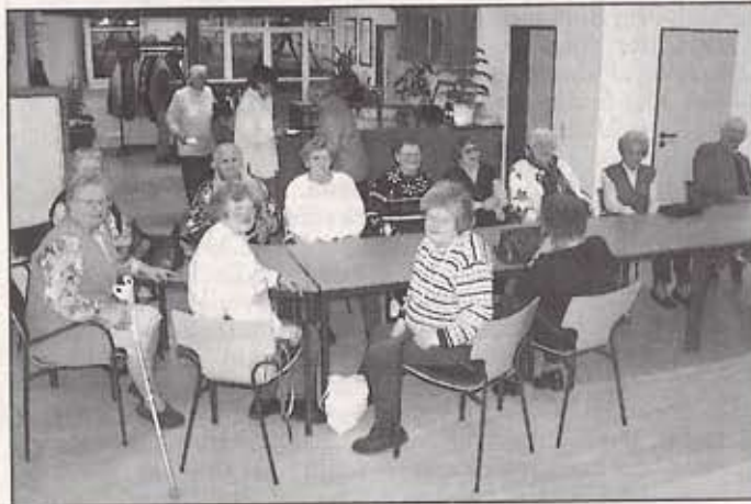
Ein anderer Seniorennachmittag: Mitglieder der Volkssolidarität waren Gäste bei der Überbetrieblichen Ausbildungsgesellschaft.

Tag durchgeführten Weihnachtsverkauf der Juniorenfirma der ÜAG mbH noch das ein oder andere Präsent für Weihnachten zu erwerben.