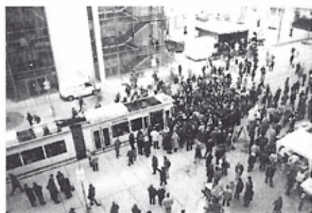
„Straßenbahnpremiere“ auf dem Ernst-Abbe-Platz

Das Gesamtkonzept der Erweiterung und Modernisierung des Straßenbahnnetzes der