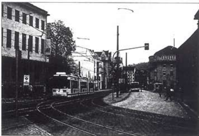
Die Haltestelle Löbdergraben für die SL 1, 2 und 4 und die das Stadtzentrum an- fahrenden Busse. Die Bahn kreuzt signalgesichert und mit Andreaskreuz die Kfz-Fahrbahn, zudem hebt sich die Straßenbahntrassenpflasterung von jener der Straße farblich ab.