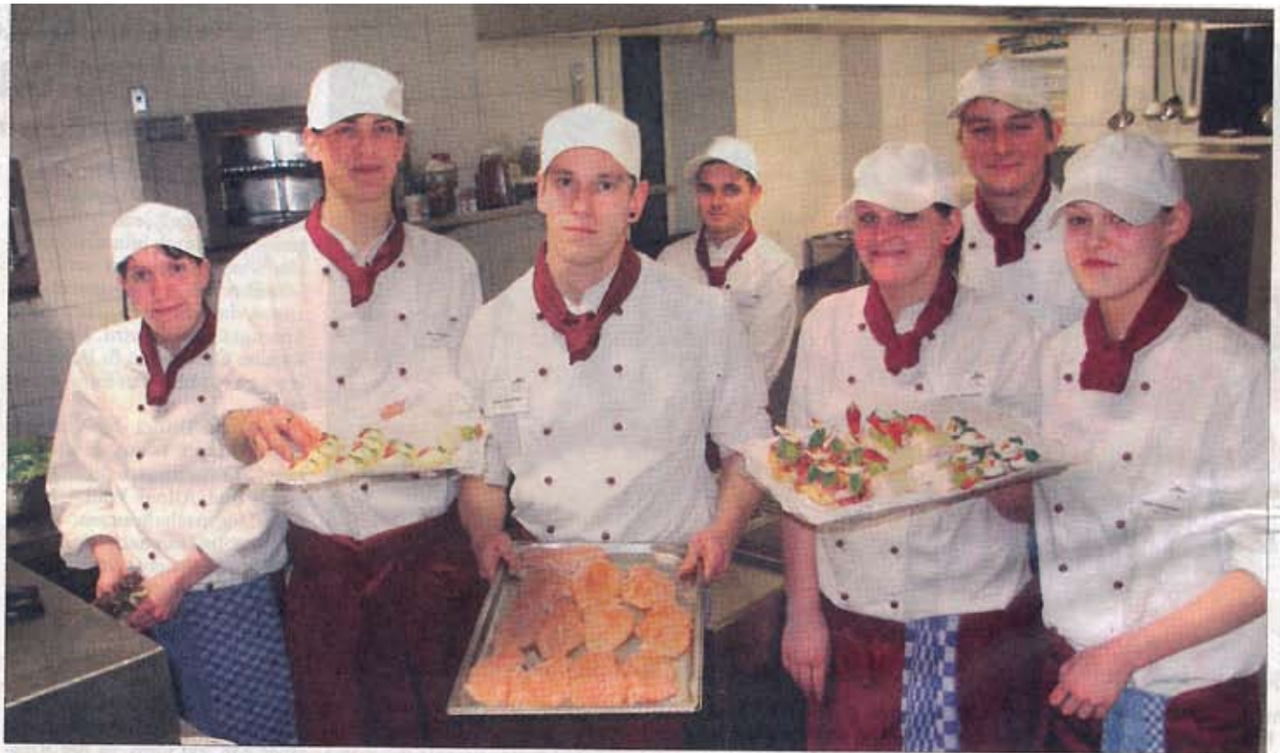
Überall Edelstahl: In der Lehrküche des Hauses Wettin finden die künftigen Köche – hier Auszubildende des ersten Lehrjahres – die besten Bedingungen vor, um ihren Beruf zu erlernen.