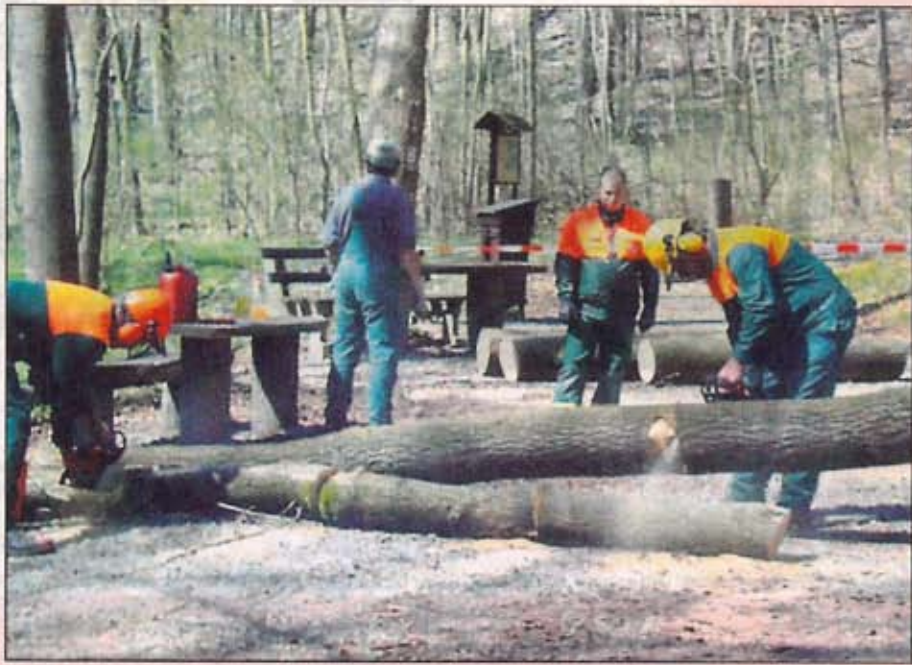
Harte Männer im Einsatz: Mitarbeiter der ÜAG und des städtischen Forstes Jena machen das Areal um den Fürstenbrunnen schöner und schützen vor morschen Bäumen.