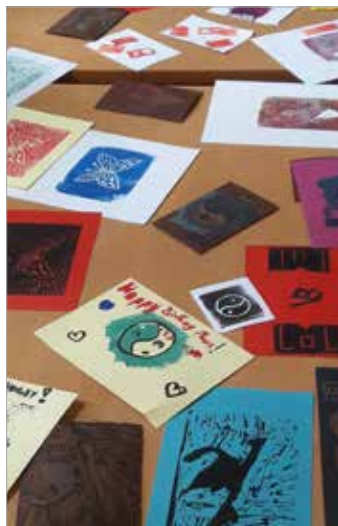
Linol- und Stencildruck in Bucha

kreative Angebote als auch erlebnis- und naturpädagogische Abenteuer sind in zweibis vierstündige Workshops verpackt. In der Kinderakademie engagieren sich über 40