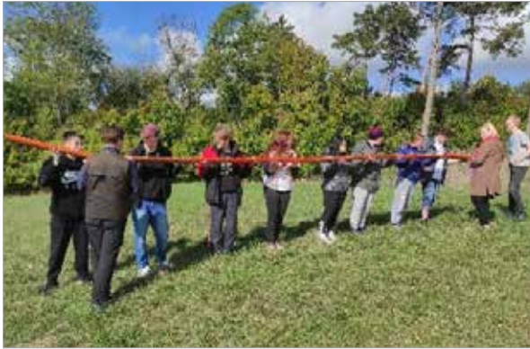
Teamtraining beim BVB

Im September begrüßten wir u. a. 38 Teilnehmende in drei Berufsvorbereitenden Bildungsmaßnahmen (BvB). Sind die Voraussetzungen der Jugendlichen auch ganz unterschiedlich, so verfolgen doch alle ein Ziel: „Wir wollen fit sein für eine Ausbildung im nächsten Jahr!“