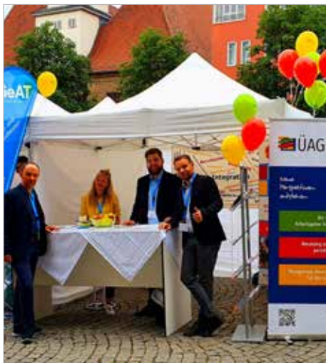
Berater*innen der ÜAG beim Jobwalk

Am 09. Juli fand auf dem Marktplatz im Herzen Jenas zum dritten Mal der sehr beliebte Jobwalk statt. Leider stand die diesjährige Ausgabe unter keinen guten Vorzeichen, waren doch viele Wolken und Regen vorhergesagt. Entsprechend wetterfest vorbereitet, war die ÜAG dieses Jahr erneut mit zwei Ständen bei der Open-Air-Messe vertreten: Beim Bewerbermappencheck konnten Interessierte ihre Bewerbungsunterlagen von fachkundigen Mitarbeiter*innen der ÜAG prüfen lassen und sich hilfreiche Tipps und Anregungen rund um die Stellensuche holen. Am Hauptstand der ÜAG wurden die einzelnen Unternehmensbereiche vorgestellt, Fragen beantwortet und die vakanten Stellen in den vielfältigen Projekten und Maßnahmen präsentiert.