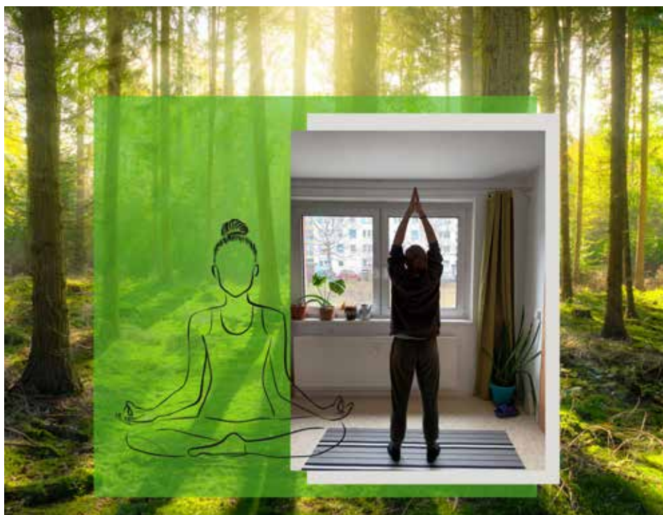
Wir tanken Energie und trotzen der kalten Jahreszeit mit dem Sonnengruß