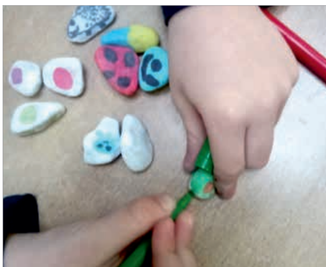
Steine bemalen für ein selbstgemachtes Tik-Tak-Toe-Spiel

Die Gemeinschaftsunterkunft wurde in Folge des Ukraine-Krieges und der damit verbundenen Welle an neu Geflüchteten im August 2022 eröffnet. Zwei pädagogische Fachkräfte der ÜAG und eine Bundesfreiwilligendienstleistende kümmern sich um alle Belange der Bewohner. Leider bleibt den Mitarbeitenden wenig Zeit für zusätzliche soziale oder gemeinschaftliche Angebote.