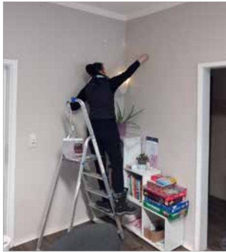
Renovierung der Praxis- und Sozialräume

Weitere wichtige Schritte waren die Klärung der Räumlichkeiten und deren Ausgestaltung. Als schöner Jahresabschluss fand eine gemütliche Weihnachtsfeier gemeinsam mit den Teilnehmenden vom Projekt „MIT“, welches sich am gleichen Standort in Kahla befindet, statt.