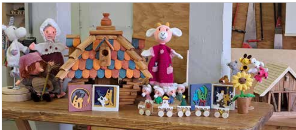
Ergebnisse der Kreativwerkstatt