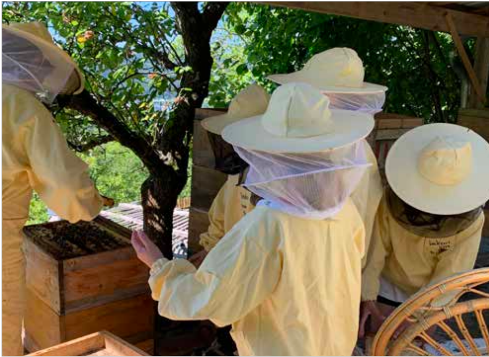
Beim Imkerei-Workshop können Bienen hautnah erlebt werden

120 Schüler:innen nahmen bisher an kostenfreien Workshops teil