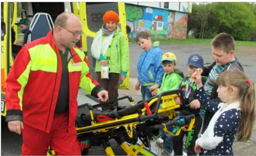
Bild vom KuBuS-Erste-Hilfe-Kurs. Die Kinderakademie wird vorwiegend von der Sparkassenstiftung Jena-Saale-Holzland und jenawohnen gefördert.