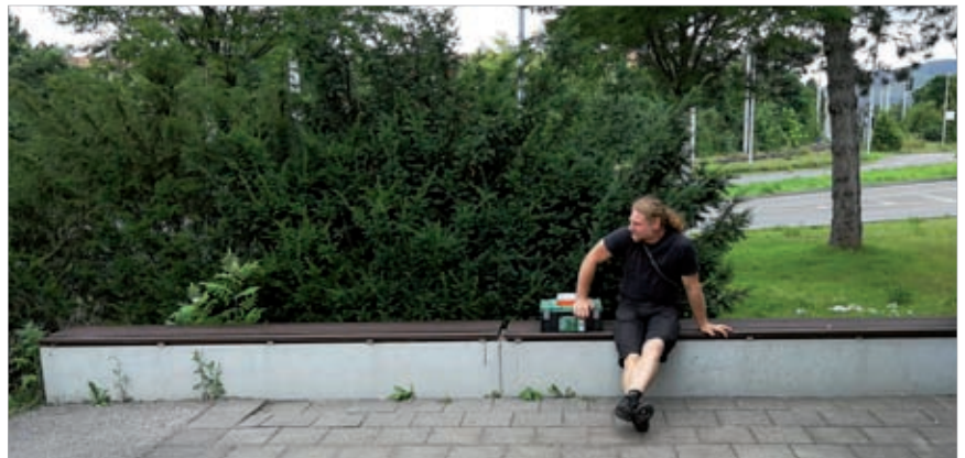
Bei der Reparatur der Bänke war handwerkliches Geschick gefragt, nach getaner Arbeit erfolgte die Sitzprobe