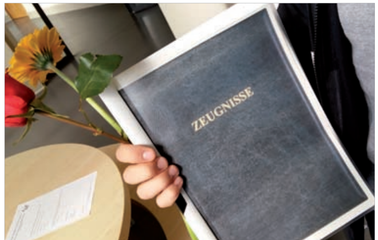
Stolz präsentieren die Teilnehmenden des Jugendberufshilfeprojekts KP14 ihre Abschlusszeugnisse