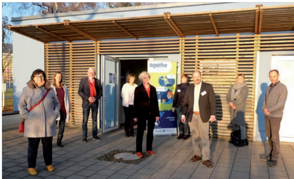
Zur Auftaktveranstaltung begrüßten wir zahlreiche Netzwerkpartner