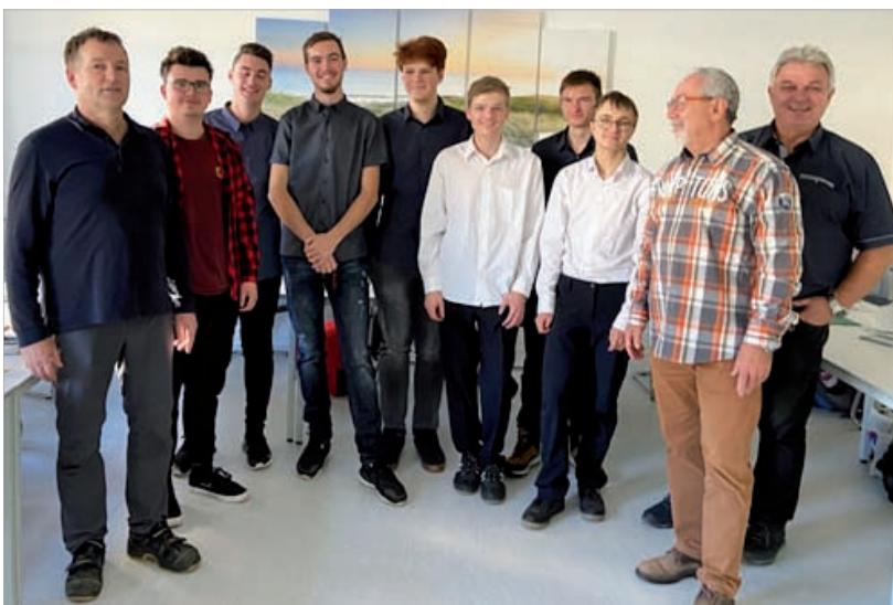
Erasmus-Teilnehmer mit ihren tschechischen Betreuern und unserem Ausbilder am letzten Tag in der ÜAG gGmbH

Des Weiteren führen wir mit der Schule in Tremosnice aktuell das Erasmus+ CNC-Projekt „Vom technischen Zeichnen zum CNC-Programm“ durch. Erste Lernmaterialien und die erstellten Programme zur CNC-Bedienung werden aktuell von unseren Ausbildern auf ihre praktische Anwendbarkeit geprüft, damit sie den Auszubildenden in der Zukunft für Lernen und Wissenserwerb zur Verfügung gestellt werden können. Programmierung und Umsetzung basiert auf Siemens Sinumerik, die als Standardsoftware bei der ÜAG Jena eingesetzt wird.