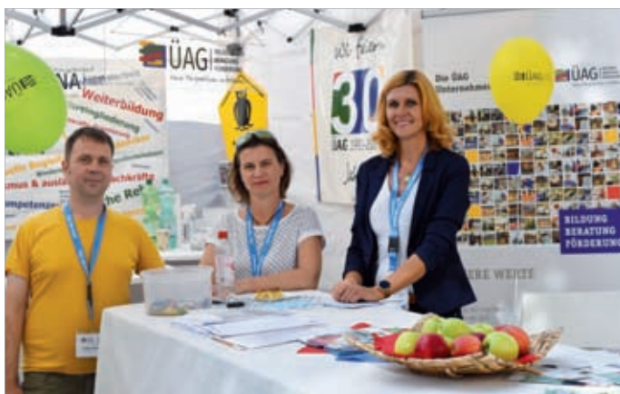
Mitarbeitende der ÜAG am hauseigenen Stand