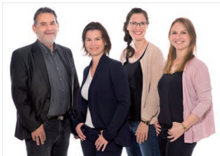
Das Team vom Projekt Ausbilden 4.0: EducationMove

Das Projekt Ausbilden 4.0: EducationMove läuft am 30.06.2022 aus. Bis dahin ist noch viel zu erreichen. Eines ist bereits jetzt deutlich: der Fachkräftemangel sowie die gestiegenen Herausforderungen durch