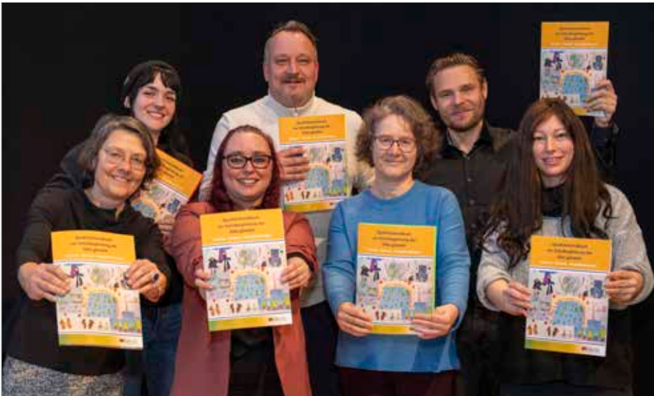
Stolze Präsentation des Qualitätshandbuches in der Imaginata Jena